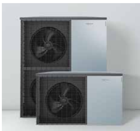
Buitenunits in Viessmann-design: Made in Germany