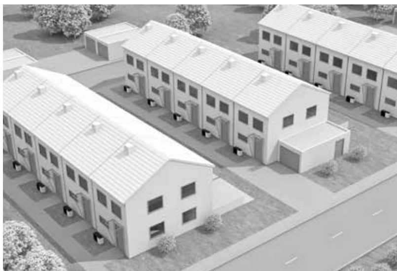
Bijzonder geruisloze werking, ideaal voor gebruik op locaties met rijhuizen

Via de Vitotronic 200-regeling kunt u de warmtepompen vanaf eender welke locatie via de onlinemodule Vitoconnect (toebehoren) en de gratis ViCare-app bedienen. En u kunt ze ook combineren met Vitovent centrale woningventilatietoestellen.